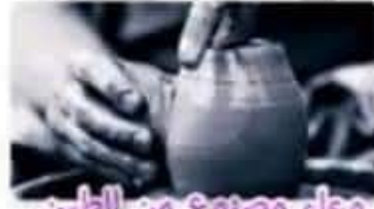
وعاء مصنوع من الطين. A pot is made from clay.