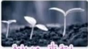
نبته تأتي من بذرة. A plant comes from a seed.

الاسئلة المهمة في الكتابين ممكن تستعينوا بيها في وضع أسئلة الامتحان. كتاب النشاط ص 28.